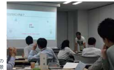
CSR調達の社内研修風景